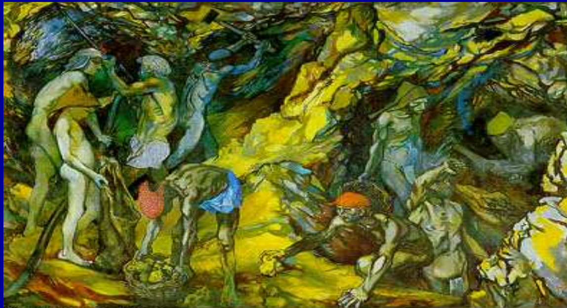
Guttuso: La zolfara